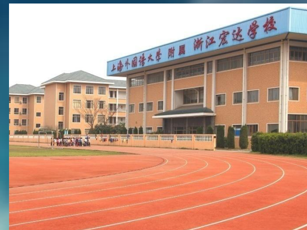
■ 上海外国语大学附属浙江宏达学校