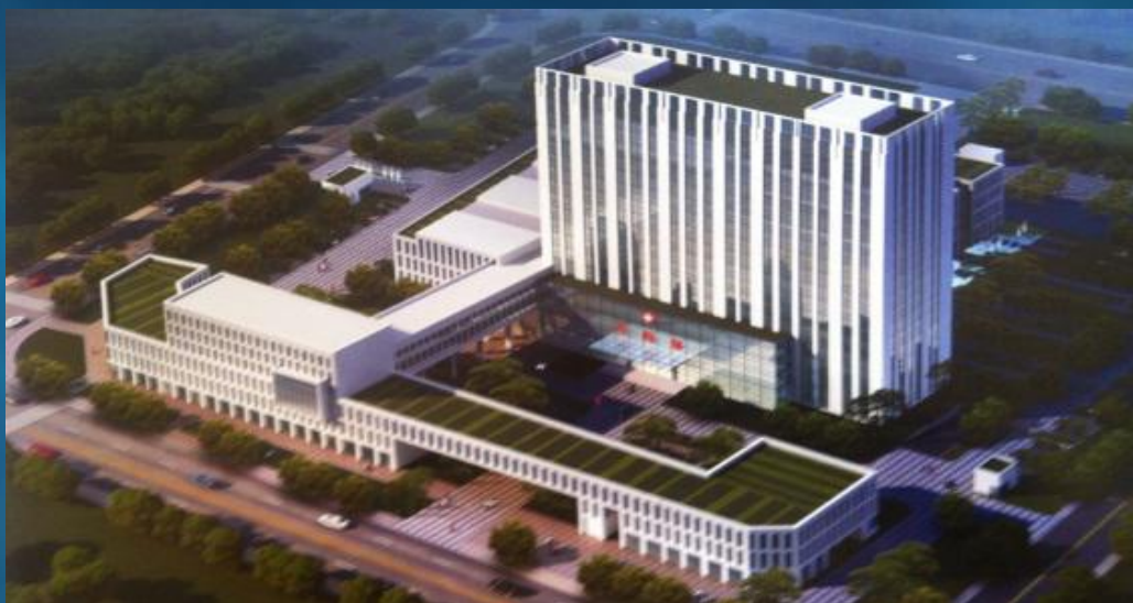
■ 浙江省人民医院海宁分院