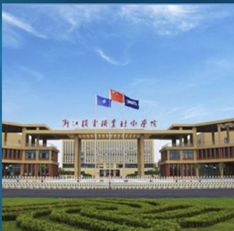
■ 浙江机电职业技术学院