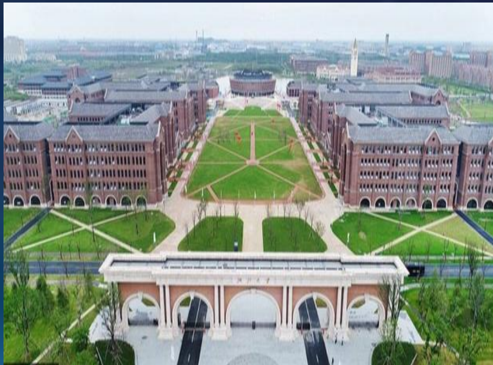
■ 浙江大学国际联合学院