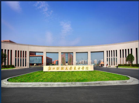
■ 浙江财经大学东方学院