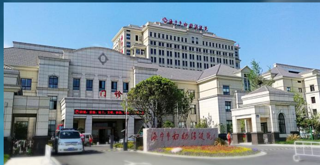
■ 浙江大学附属妇产科医院海宁分院